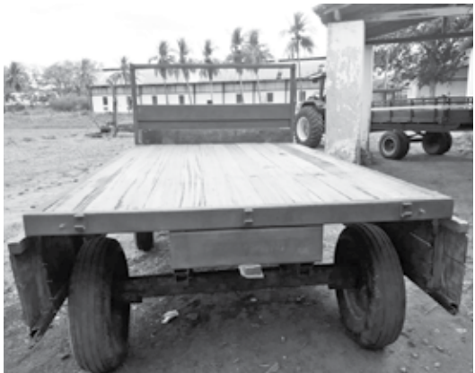
Empaer recuperou dois carroções que estavam danificados