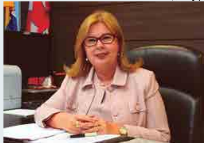
Desembargadora Fátima Bezerra: "Beijo as mãos e o rosto do meu amado"