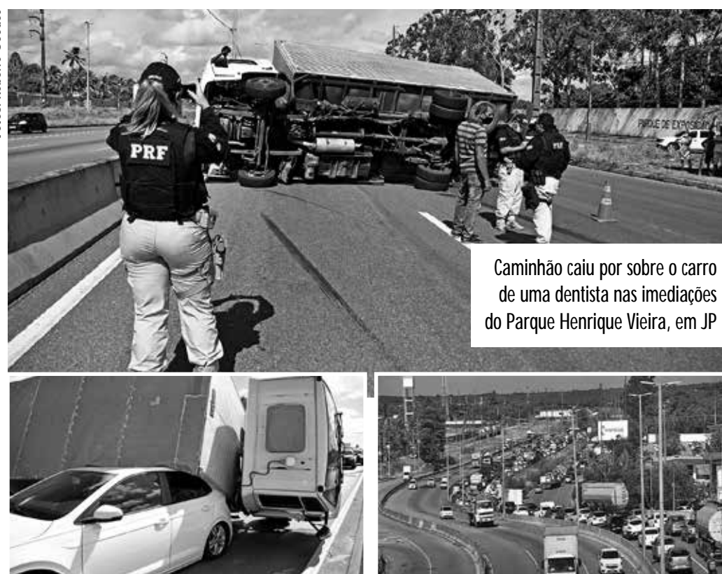
Caminhão caiu por sobre o carro de uma dentista nas imediações do Parque Henrique Vieira, em JP