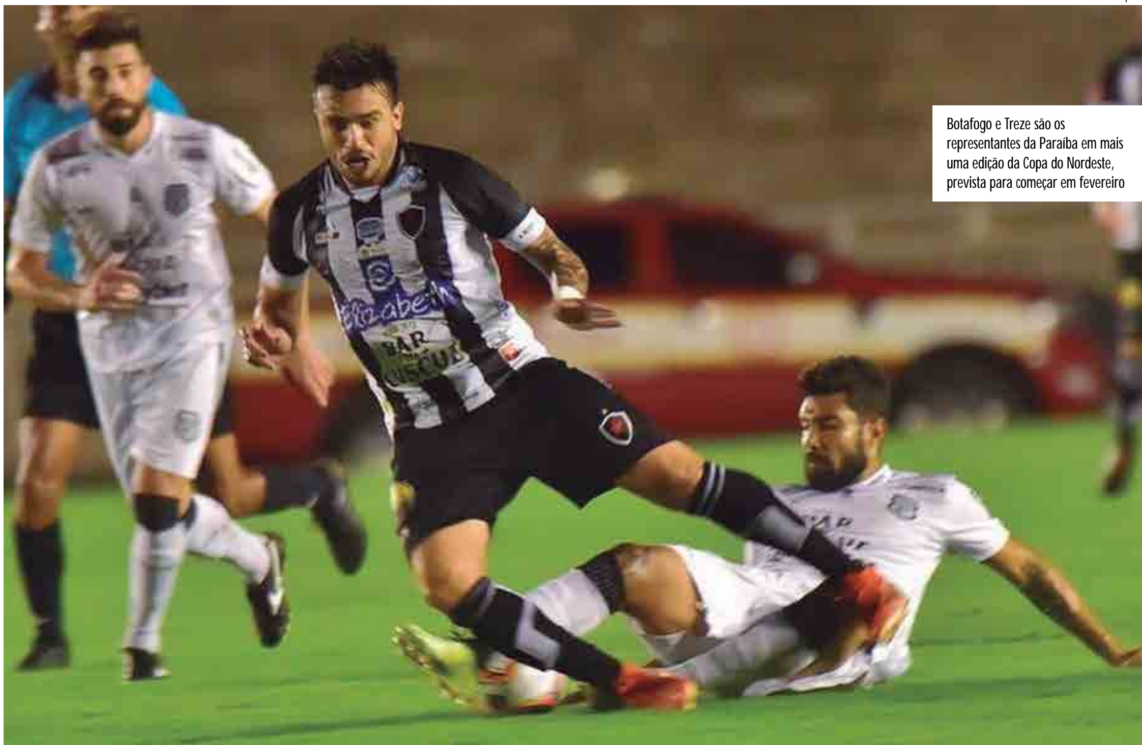
Botafogo e Treze são os representantes da Paraíba em mais uma edição da Copa do Nordeste, prevista para começar em fevereiro