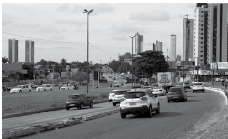
Trecho da BR-230 em João Pessoa que está dentro do projeto de ampliação