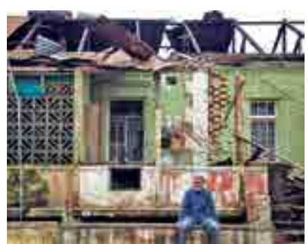
Países mais pobres são mais afetados e vulneráveis aos efeitos devastadores

Os países ricos tinham prometido aumentar a ajuda climática aos países em desenvolvimento para US$ 100 bilhões por ano a partir de 2020, o que ainda não foi cumprido.